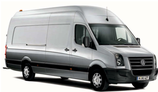
Рис. 5 Мобильная лаборатория

Специалисты ООО «ТЭК-Тех» с учетом Ваших задач, наших знаний и опыта квалифицированно выполняют для Вас подбор оборудования, разработку решения, изготовление, поставку, монтаж, пуско-наладку, обучение, консультации и сервис.