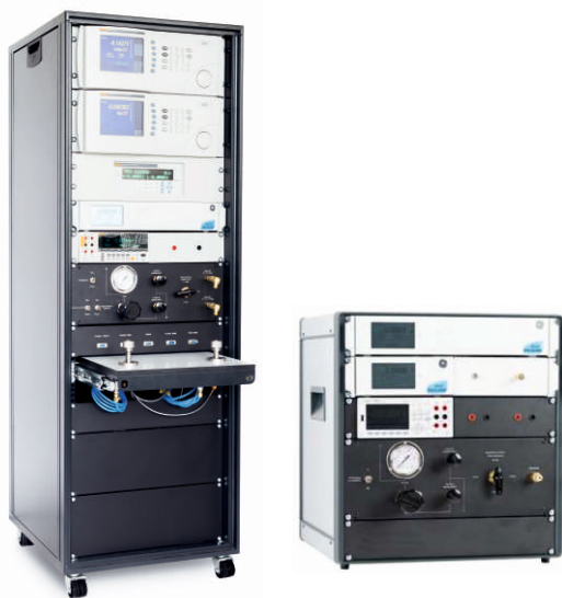
Рис. 3. Метрологические стойки

Многолетний опыт работы с различными организациями, мониторинг рынка и общение с главными метрологами на профильных мероприятиях показали, что есть потребность в компактных стационарных или портативных решениях метрологических и сервисных задач в условиях ограниченного пространства помещения, модернизации действующего рабочего места с интеграцией в него современного оборудования, работы с выездом на объект. С целью решения этой задачи нами были разработаны и уже успешно внедрены в производство и поставки: - метрологические стойки (рис. 3) настольного, напольного, портативного или встроенного в рабочее место пользователя исполнения (в помещении, автомобиле, вагоне, чемодане и др.), комплектация и исполнение индивидуальные под задачу пользователя; - пневматические стенды (рис. 4) для установки 2/4/5 и более СИ давления с быстросъемными соединениями. Различные исполнения: с встроенным грязеуловителем, отсечными клапанами на каждый порт давления (для разных ВПИ), прецизионными переключателями и редукторами для ручного регулирования давления, электрической коммутацией (для ЭКМ, датчиков).