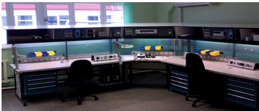
Рис. 1. Стенд для поверки/калибровки/ремонта СИ давления, температуры, электрических сигналов

Компания ООО «ТЭК-Тех» являясь разработчиком, изготовителем, официальным представителем и сервисным центром контрольно-измерительного и метрологического оборудования, применяемого во всех отраслях промышленности, обладает всем необходимым для переоснащения и создания современных лабораторий служб КИПиА, метрологии, сервиса.