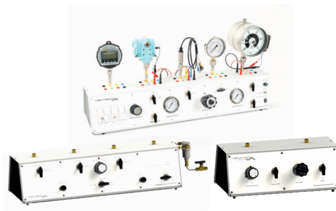
Рис. 4. Пневматические стенды для регулирования давления

Оборудование ООО «ТЭК-Тех» имеет успешный опыт эксплуатации в Газпром, Газпром Нефть, Роснефть, Сибур, НОВАТЕК, Сургутнефтегаз, Росатом, УКБП, ЭОКБ «Сигнал», Акрон, Севмаш, Ростест, Уралтест, ЦСМ и во многих других компаниях.